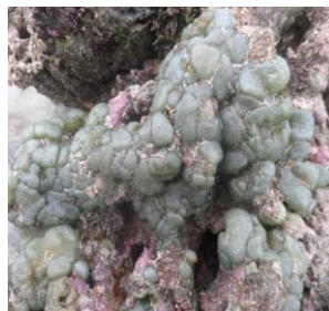
Gambar 1. Alga Laut Hijau Silpau ( D. Versluysii )

Silpau berkembang biak secara aseksual dan juga seksual. Reproduksi secara aseksual yaitu dengan pemisahan koloni. Proses ini dimulai dengan menghasilkan koloni anak didalam koloni induk. Kemudian tumbuh keluar dalam bentuk gelembung dan membentuk koloni yang terpisah. Reproduksi secara seksual dilakukan dengan membebaskan sel gamet jantan betina melalui pori-pori pada dinding sel. Spesies alga hijau ( D. versluysii ) seperti terlihat pada Gambar 1.