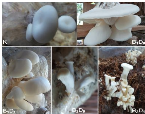
Gambar 1. Primordia dan tubuh buah jamur tiram putih pada setiap perlakuan

Jamur tiram putih yang dihasilkan dalam penelitian ini memiliki morfologi yang tidak seragam antar maupun di dalam kelompok perlakuan. Variasi morfologi yang terjadi ada pada jumlah primordia, lebar tudung buah dan panjang tangkai jamur yang dihasilkan, hal ini dapat dilihat pada Gambar 1.